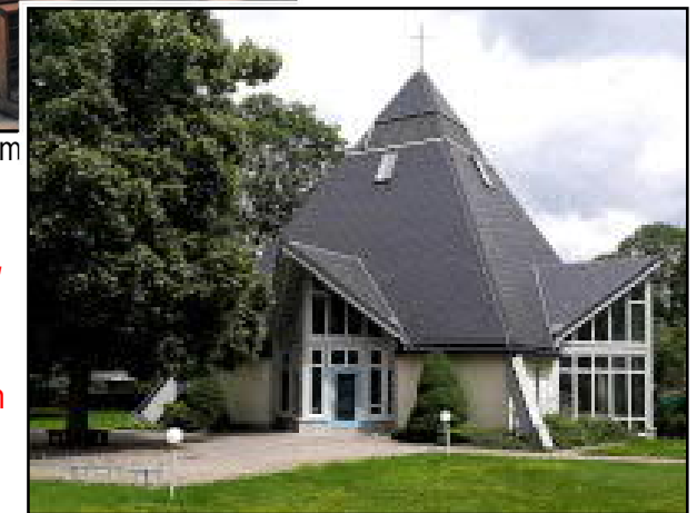
Die Olbernhauer kath. Kirche – seit 1997